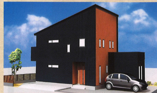
2021・2/7 日 ・8 月 盛岡 向中野会場