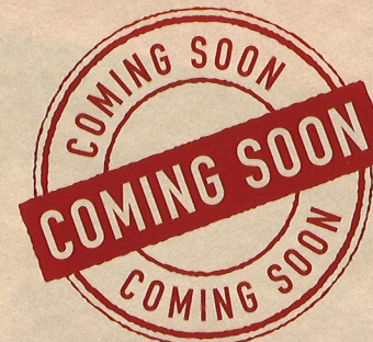
2021・4/17 土 ・18 日 紫波会場