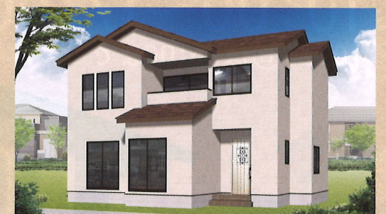
2021・5/9 日 ・10 月 盛岡 飯岡新田会場