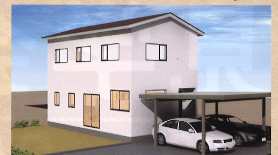
2021・3/13 土 ・14 日 滝沢 巣子会場