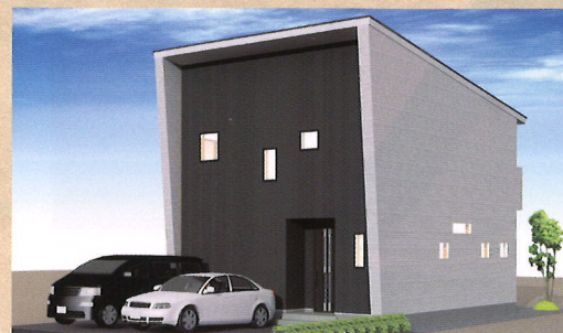
2021・3/27 土 ・28 日 盛岡 向中野会場