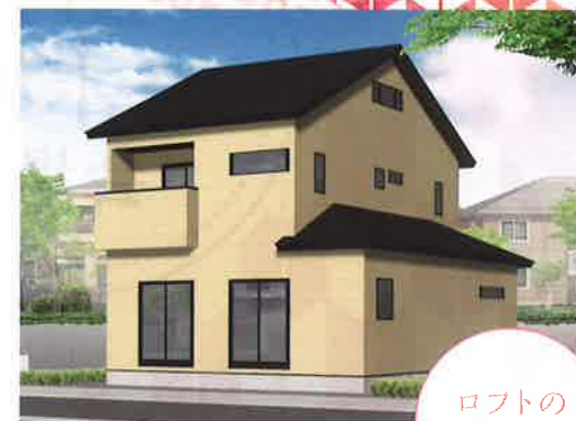
12/4日・5日 盛岡 境田町会場