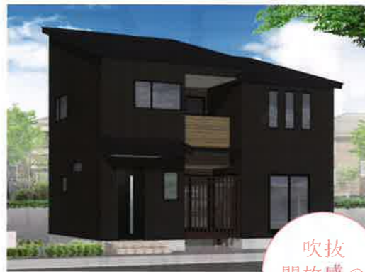
11/6日・7日 盛岡 北飯岡会場