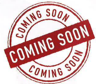
R4. 3/26日・27日 盛岡 向中野会場

※日時変更の場合があります。 ※外観完成予定図は設計仕様変更で変更になる場合があります。