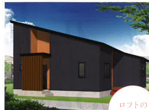
11/13日・14日 盛岡 中太田会場