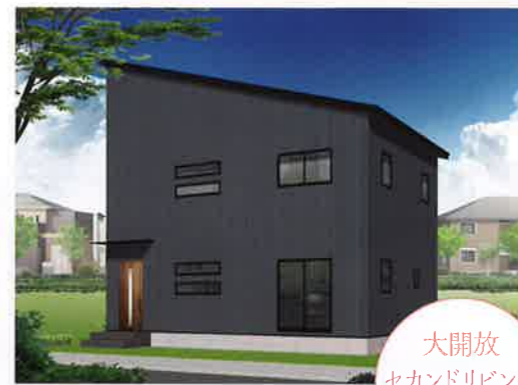
R4. 2/26日・27日 盛岡 東見前会場